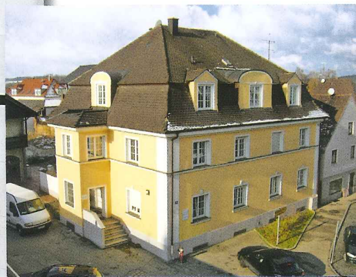
Edel – und veredelt: Ein „Huber-Bad“ und eine Komplett-Haus-Renovierung